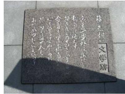
横光文学碑・碑文