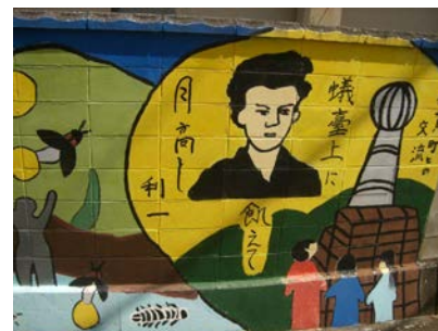
長峰小学校塀(伊賀の小学生との交流)