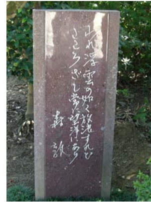
森敦碑 (教覚寺境内)