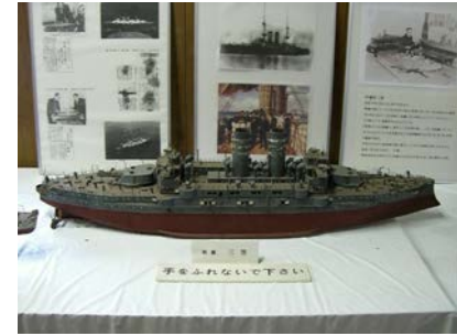
軍艦三笠模型 (教覚寺)